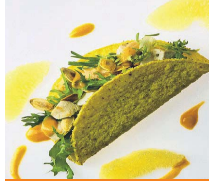
Kip en tofu in taco.