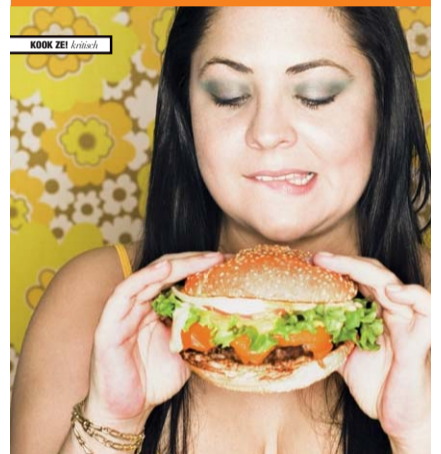
Hamburger onder de loep.